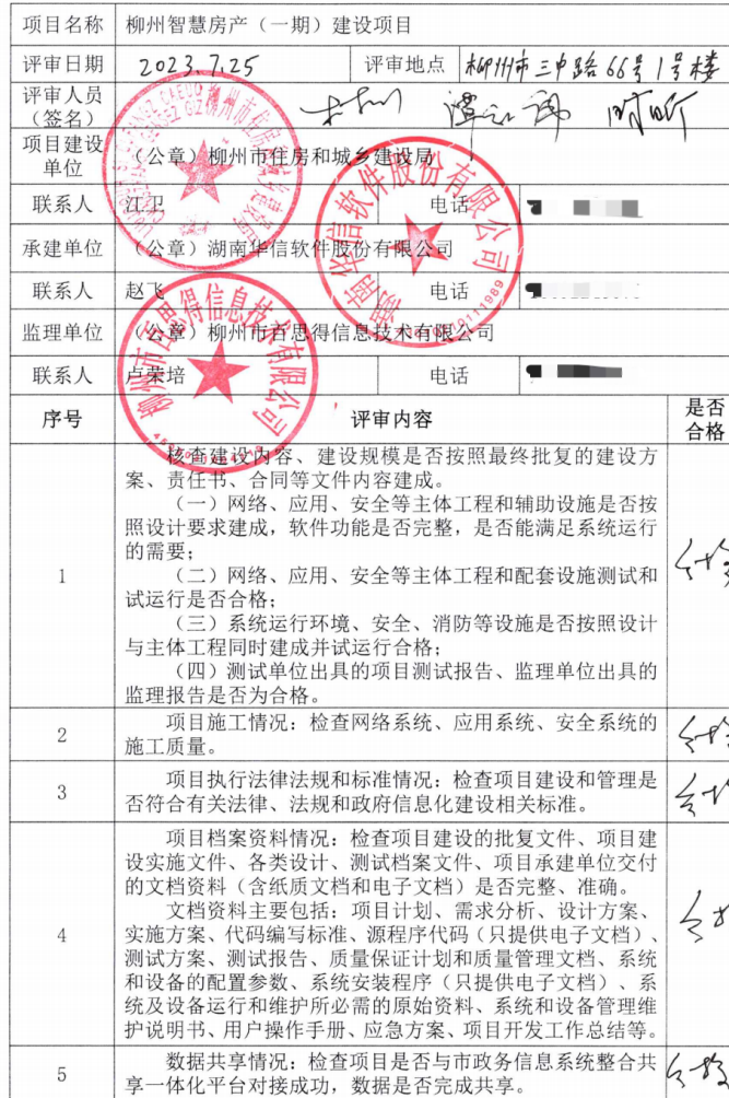
柳州市政府投资信息化项目竣工验收评审表