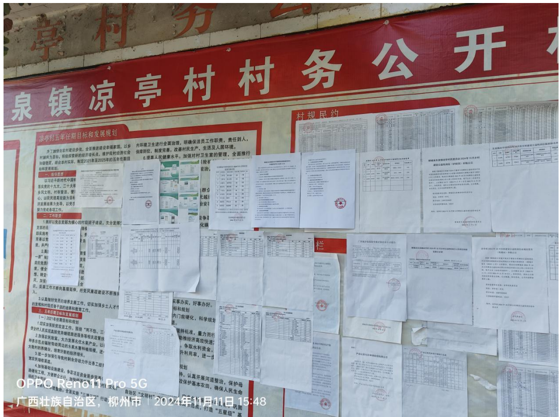
图3-4 凉亭村公告栏张贴项目第二次公示照片