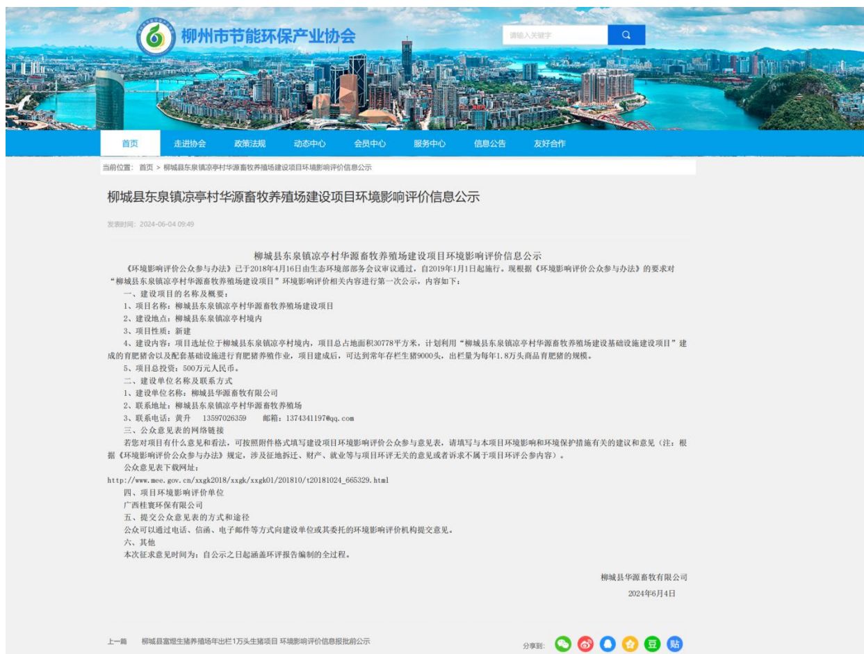
图 2-1 项目环境影响评价信息第一次公示网络截图