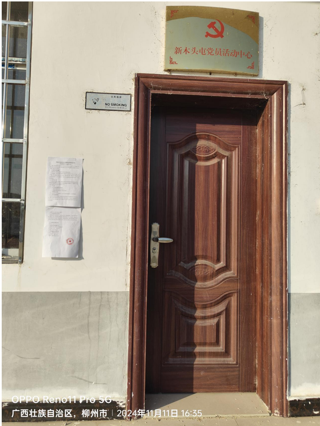
OPPO Reno11 Pro 5G 广西壮族自治区，柳州市 | 2024年11月11日 16:35