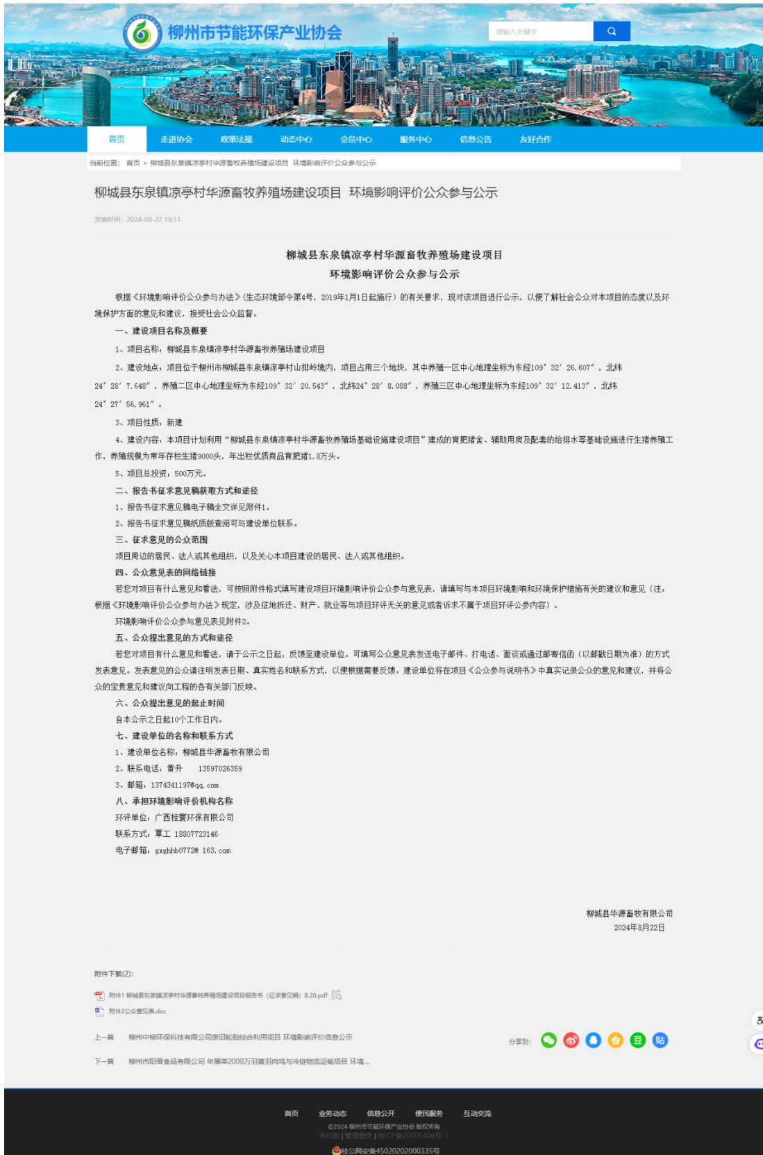
图3-1 项目环境影响评价信息第二次公示网络截图