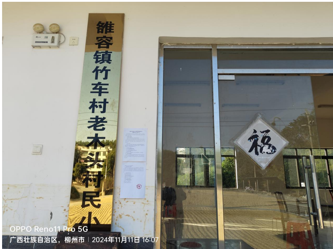
OPPO Reno11 Pro 5G 广西壮族自治区，柳州市 | 2024年11月11日 16:07