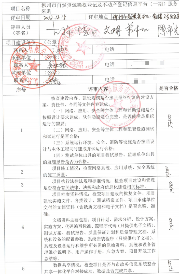
柳州市政府投资信息化项目竣工验收评审表