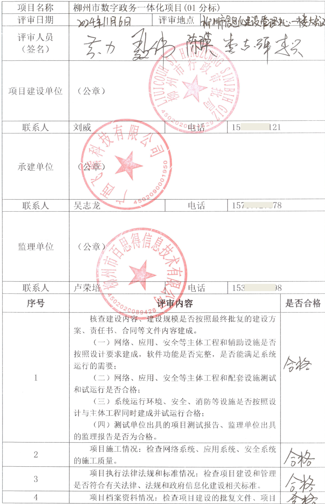
柳州市政府投资信息化项目竣工验收评审表